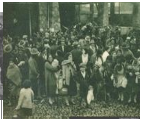
Familias cesantes, 1932