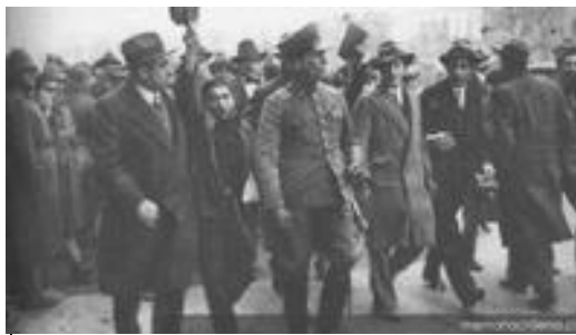
Multitud en las calles celebrando la caída de Ibáñez, 1931